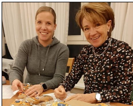
Drei-Königs-Aktion «Bei uns sind alle Könige»